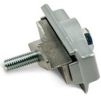
3-Phasen Adapter mechanisch